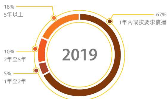
於2019年12月31日，合併債務按到期年份劃分