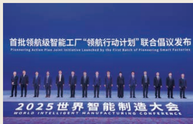
南鋼集團入選工信部首批領航級智能工廠培育名單

二零二五年，中信股份及旗下子公司榮獲國家級、省部級及行業知名科技類獎項97項。榮獲中國人民銀行2024年度金融科技發展獎18項，含一等獎2項，蟬聯獲獎最多的企業；獲獎項目中過半數為人工智能創新成果。在國家數據局等多部門聯合舉辦的「數據要素×」大賽全國總決賽中，榮獲包括一等獎在內的4個獎項，獲獎數量位居企業前列。南鋼集團入選工信部首批領航級智能工廠培育名單，代表全國智能製造最高水平；中信重工、中信泰富特鋼4個項目入選工信部卓越級智能工廠，中信股份卓越級智能工廠總數增至6家。截至二零二五年末，公司擁有知識產權近13,800項，有效專利9,300餘項。