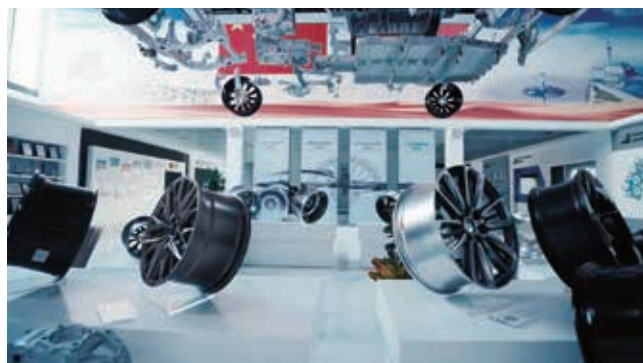
中信戴卡輕量化汽車零部件

特色業務： 低空經濟業務持續拓展應用場景並取得新突破。出版業務穩固行業領先地位。數字經濟業務、智能工廠建設取得新突破。資源、能源供應鏈保障能力持續提升。