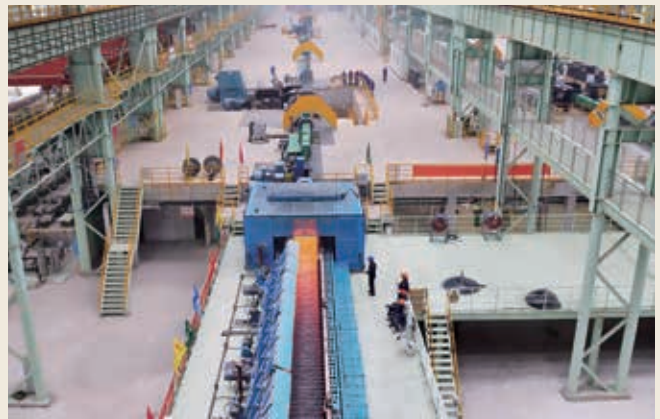
超高強度橋樑纜索用鋼

二零二五年九月，貴州花江峽谷大橋正式建成通車。這座「橫豎」都是世界第一的大橋，以橋面距水面625米的驚人高度和1,420米的主橋跨徑，刷新了橋樑跨徑與高度的雙重世界紀錄。花江峽谷的複雜地質條件和極端氣候，對大橋纜索材料的強度和韌性提出了極高要求。中信泰富特鋼旗下青島特鋼科研團隊創新研發超高強度橋樑纜索盤條，通過精確調配合金成分和創新優化控軋控冷工藝，使盤條在熱軋狀態下具備優異的高強塑性。該技術研發的橋樑纜索強度更高，單絲承載力更強，能夠輕鬆承受巨大拉力，確保大橋在強風、重載等嚴苛環境下的安全穩定。