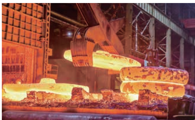
中信重工用於新能源領域的特種材料鍛壓

「造星」行動： 圍繞延鏈補鏈強鏈、戰略性新興產業布局，聯動中信旗下產業公司、投資平台和金融資源建立投資併購項目儲備庫，並跟進多個重點項目盡調論證工作。