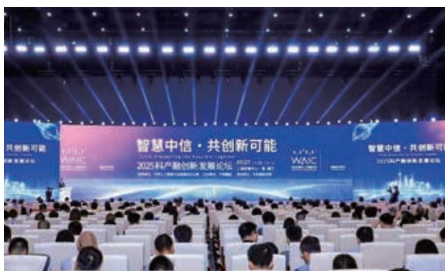
中信在2025世界人工智能大會上舉辦科產融創新發展論壇

—● 截至二零二五年末，8個科創平台已全部建成落地，中信香港人工智能科創中心進入實質性科研階段。