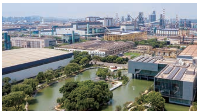
中信泰富特鋼低碳廠區

落實國家「雙碳」戰略部署，制定「兩增一減」低碳發展戰略，明確「碳達峰 碳中和」目標，出台《2024-2025年節能降碳行動方案》，連續四年發布《碳達峰碳中和白皮書》，推動實業綠色低碳轉型，引領金融業務創新綠色產品和服務。搭建「全景式碳管理平台」，實現對碳排放的精準監測、科學分析和動態管理。深耕水處理及水環境治理、固廢處置等，每年處理污水8億噸。推動ESG工作的數字化、系統化、智能化，打造了中信戴卡、中信泰富特鋼、南鋼股份等一批實業領域數字化低碳轉型的行業標竿，綜合能耗大幅降低。