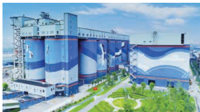
南鋼股份綠色工廠