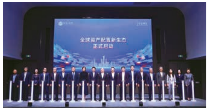
全球資產配置新生態正式啟動

穩固資產管理規模優勢。通過資產配置子委員會和資產管理工作室統籌產品創新、研究共享、投資協同、風險防控。二零二五年，中信綜合金融服務板塊資產管理規模近11萬億元，較上年末增長27%，優於行業平均增速，累計服務個人和企業客戶超2億；旗下銀行理財、券商資管、公募基金等細分領域均位居行業前列，資產管理信託規模高速增長。