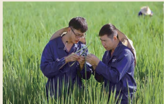
科研人員現場工作

稻瘟病是限制水稻高產穩產的重要因子。發掘廣譜抗稻瘟病基因，培育抗病品種，不僅是控制稻瘟病最經濟有效的措施，也是作物育種的重大理論與技術難題。中信農業旗下隆平高科自二零零七年開始與中國科學院分子植物科學卓越創新中心合作，利用水稻抗稻瘟病分子育種技術，定向導入Pigm基因，改良高產、優質品種的抗瘟性，創製出一批抗稻瘟病、優質、高產等綜合性狀優良的親本，並選育出了臻兩優8612、臻兩優5438、隆兩優3189等一批抗稻瘟病水稻新品種。「十四五」期間，隆平高科抗稻瘟病水稻品種推廣1,126萬畝，減施農藥67萬公斤，創收7億元，取得了顯著的經濟與社會效益。與中科院團隊合作的項目成果榮獲二零二四年度上海市科技進步獎一等獎。