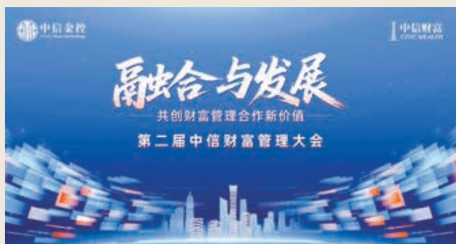
第二屆中信財富管理大會