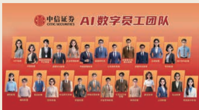
中信證券AI數字員工團隊

中信股份已建成集團級數智化管理平台「領航平台」，橫向貫通覆蓋總部38項管理職能，縱向已在財務預算、人力資源、辦公等14大場景實現一級子公司穿透管理，讓子公司經營情況「看得到、算得準、抓得住」，提升整體管理效能。把握AI智能體發展趨勢，運用數字員工提升辦公效率，其中，總部已推出制度問答助手、會議助手、寫作助手等首批6名數字員工，為員工分擔基础性、重複性工作；中信證券已有27名數字員工上崗，在智能投研、智能投行、財富管理等多個業務場景中展現價值，相關技術榮獲12項國家發明專利。