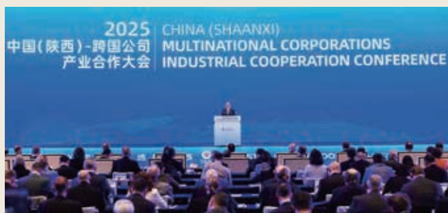
跨國公司產業合作大會