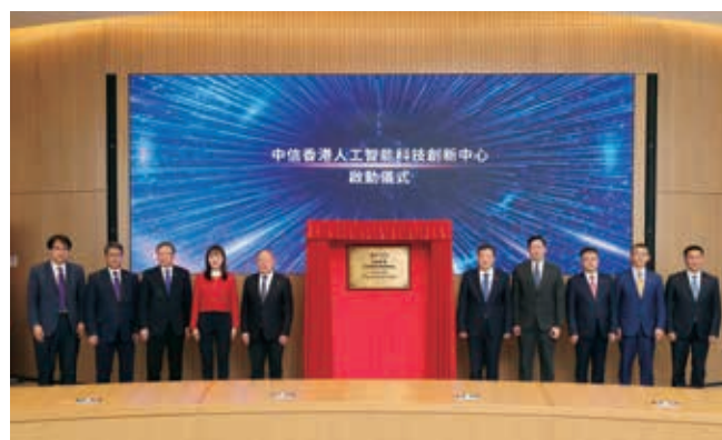
中信香港人工智能科創中心揭牌成立