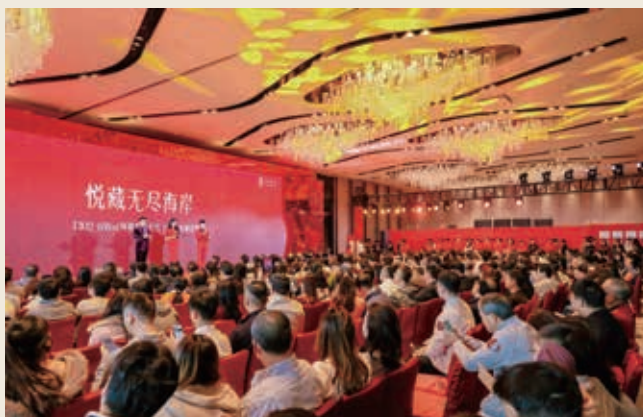
中信城開深圳信悅灣項目開盤

舉辦「第二屆中信財富管理大會」，聯合42家境內外頭部資管機構共創全球資產配置新生態。深化「中信財富」品牌矩陣，不斷提升子品牌影響力。亮相「第五屆中國國際消費品博覽會」「第三屆中國國際供應鏈促進博覽會」「2025世界人工智能大會」等國家級論壇展會。